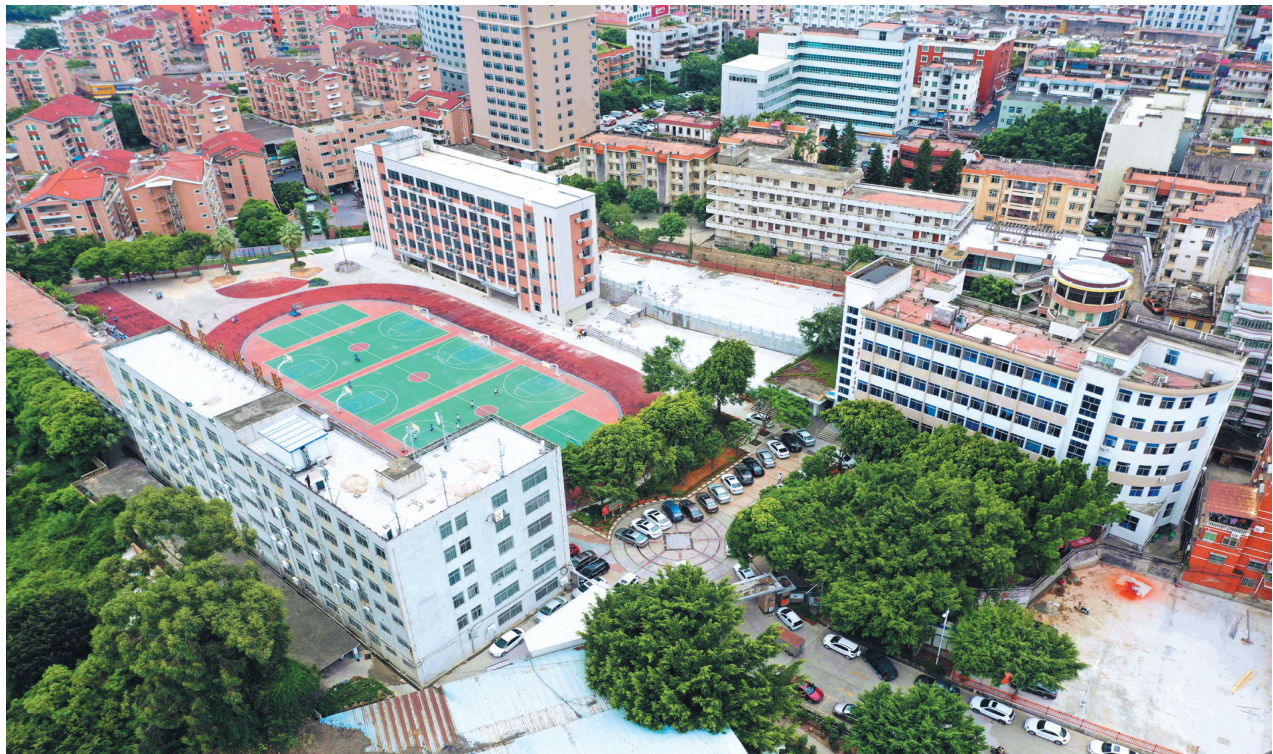
在水头镇党委、政府的支持下，水头中学教学环境得到改善。

无独有偶，在水头镇党委、政府的支持下，今年9月，南安市水头中学的师生们就搬进了新家——一座