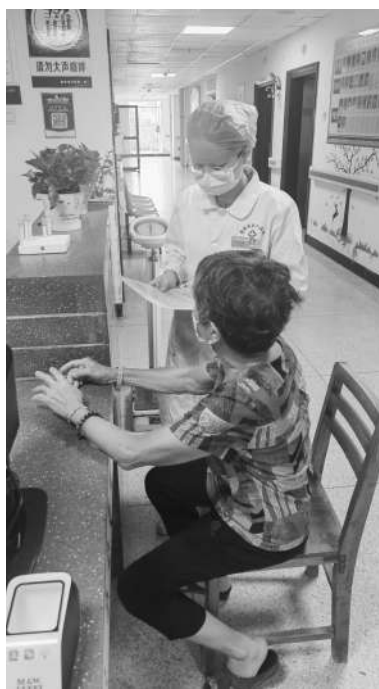
老年病科的护士为老年人开展宣教。

值得一提的是,许多老年人因病丧失了生活自理能力,为此,南安市中医院老年病科配备了一支高素质的护理队伍。“我们牢固树立‘老吾老以及人之老’的理念,像对待自己的家人一样精心护理每一位患者,在护