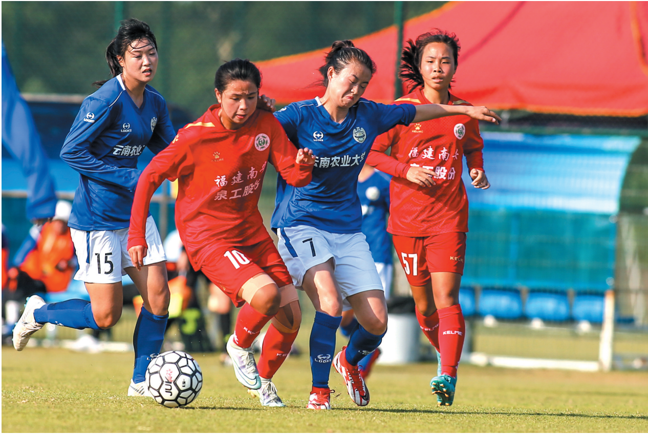
福建南安足球俱乐部泉工女足赛场风采。

“南安市是我省女子足球队‘省队市办’的最佳合作对象。”叶得盛说，体育是南安的一张闪亮名片，南安市委、市政府高度重视体育工作，南安是“全国体育先进县”、全国青少年校园足球试点县、全国县域足球典型，还是全省唯一的“奥运冠军之城”，有广泛的社会力量参与和支持体育事业的发展。期待泉州市、南安市不负重托，科学谋