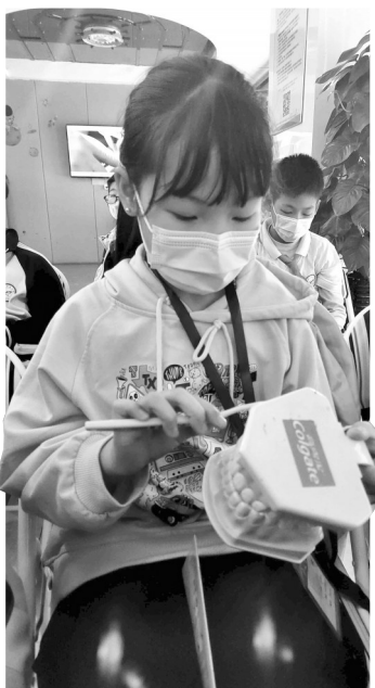
体验正确刷牙的方法。

如何正确刷牙?牙齿的构造到底是什么样的?如何预防蛀牙?保护牙齿的好习惯有哪些?5月,西锦小学40多名小记者走进水头华星口腔门诊参加“我是小牙医”职业体验活动。活动中,小记者们学习口腔知识和科学护理口腔的方法,还在操作台上为同行的同学检查牙齿,过一把牙医瘾。 通过体验,小记者不仅知道了保护牙齿的重要性,也认识到牙医没那么可怕。大家纷纷表示要爱护牙齿,养成良好的饮食及生活习惯,当一个护牙小卫士。