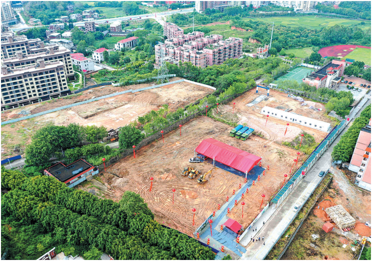
南安市工业学校新建校舍工程施工现场。

本报讯（记者 黄俊涛 黄奕群 通讯员 洪清竹 文/图）5日，南安市工业学校新建校舍工程正式开工，项目总投资超1亿元。