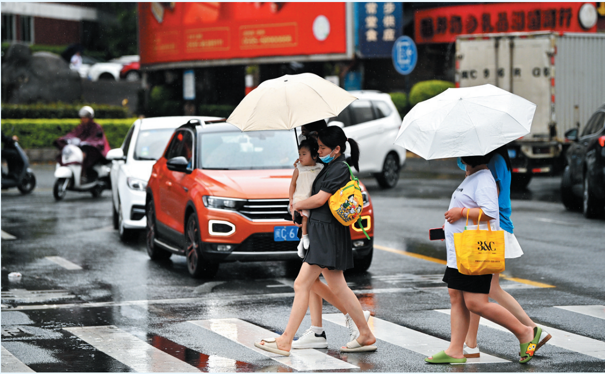
昨日下午，南安市区雨势减小，但这并不意味着降水结束。

在此提醒广大市民朋友们，今日有较明显降水，需注意防范强降雨可能引发的山洪、滑坡和城乡积涝等次生灾害，同时要关注局地强对流天气对农业生产和户外活动的不良影响；高温来袭，需做好防暑降温工作，及时补充水分；天气多变，出门记得带伞，遮阳挡雨两不误。