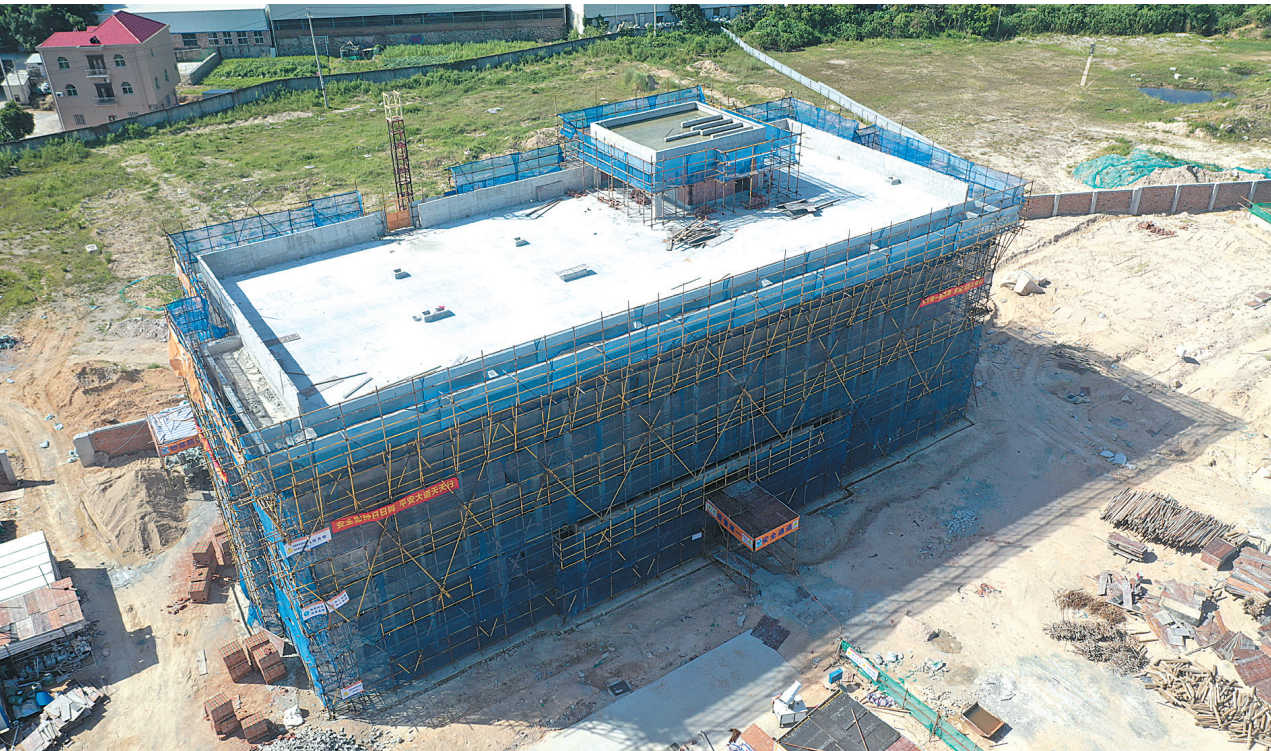
综合办公楼已完成封顶。

据悉，项目公司建成后，建筑垃圾经过破碎筛分设备的破碎筛分、清洗、分级后，生成所需规格的粗、细再生骨料、砂及微粉。再生的骨料按照设计配合比加入水泥、粉煤灰及其他外加剂，再经过全自动砌块生产线，生产出广场砖、人行步道砖、实心砌块等，这些新型建材可替代传统的黏土砖和部