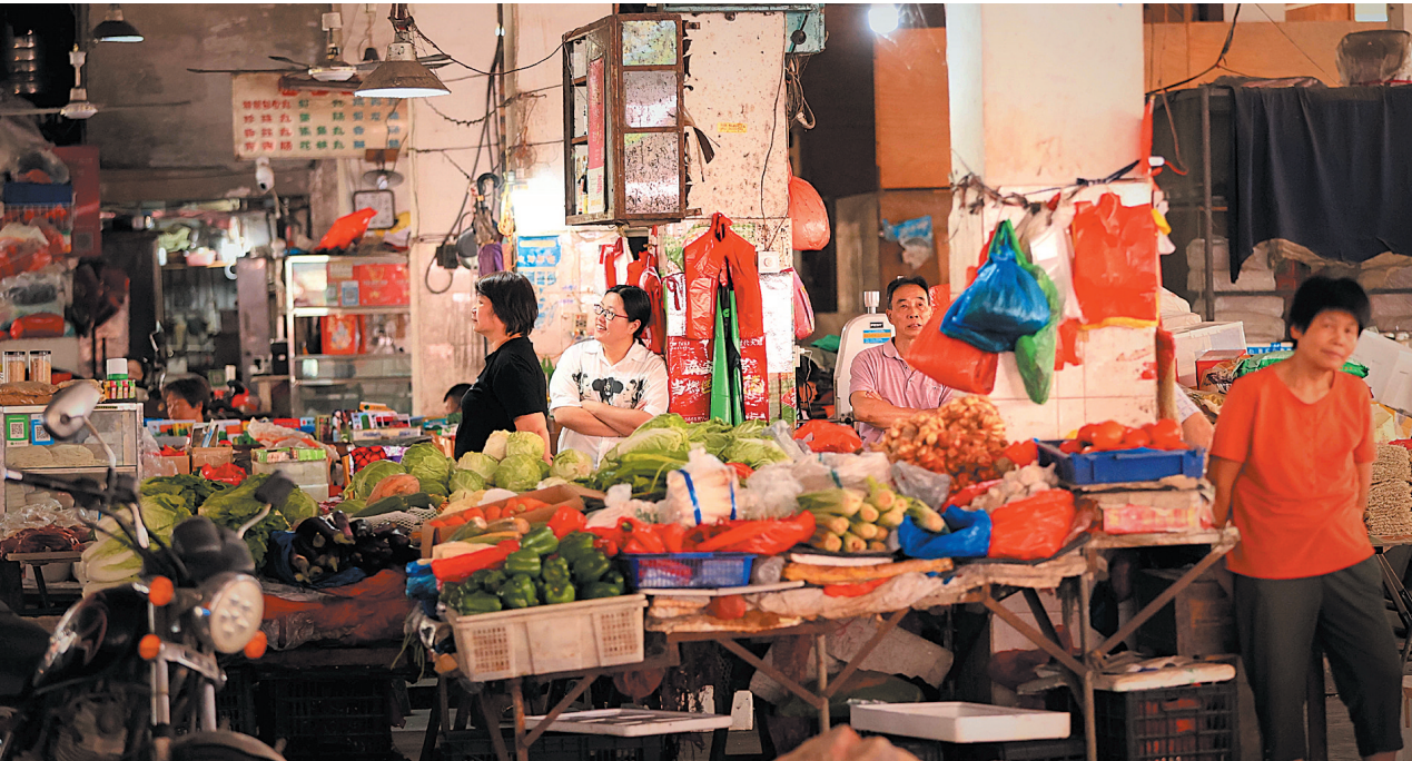
如今的码头镇菜市场冷冷清清。

4 个矩形，其中靠近镇府路右侧的矩形，将用来修建室内 15 个摊位。其余 3 个矩形将封闭起来，用来建设码头镇首个大型生鲜超市，总面积达 1500 多平方米，预计国庆节投入使用。