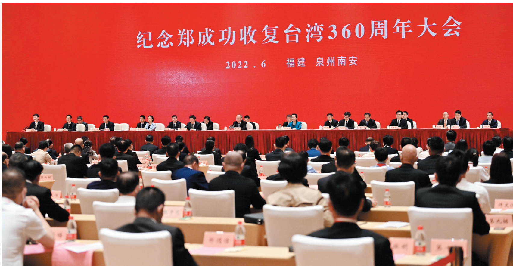
纪念郑成功收复台湾360周年大会现场。