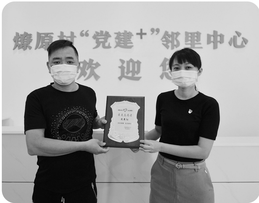
燎原村为志愿者颁发“最美志愿者”牌匾。

在这场疫情防控歼灭战中,丰州镇西华洋片区充分发挥“党建+”邻里中心作用,凝聚广大党群力量,构建党建引领、群防群控的坚固防线,全力开展“无疫村”创建。