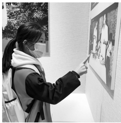
认真欣赏图片展板。