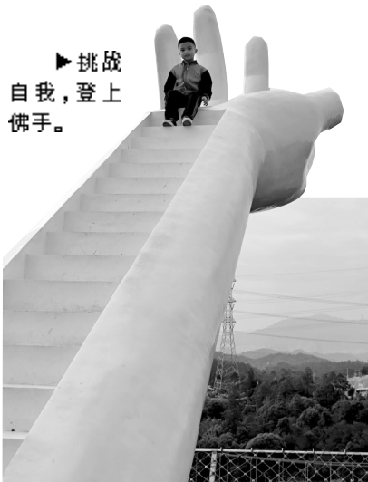
挑战自我，登上佛手。