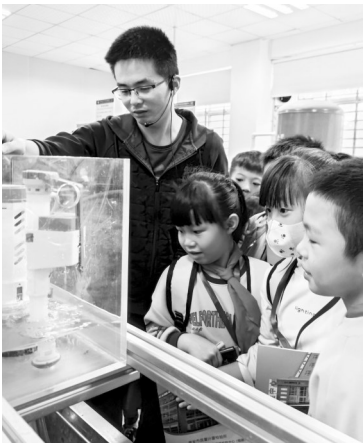
质检人员介绍质检合格标准。