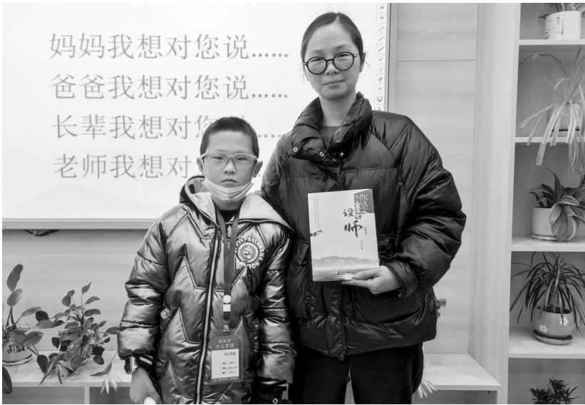
妈妈我爱你,谢谢你。