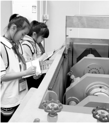
小记者参观检测设备。

都说产品质量是企业的生命,那么,在产品生产过程中,企业是如何严把产品质量关,为我们的日常生活保驾护航的呢?2月,霞美中心小学42名小记者走进国家水暖洁具产品质量监督检验中心,探究质量检测的奥秘。