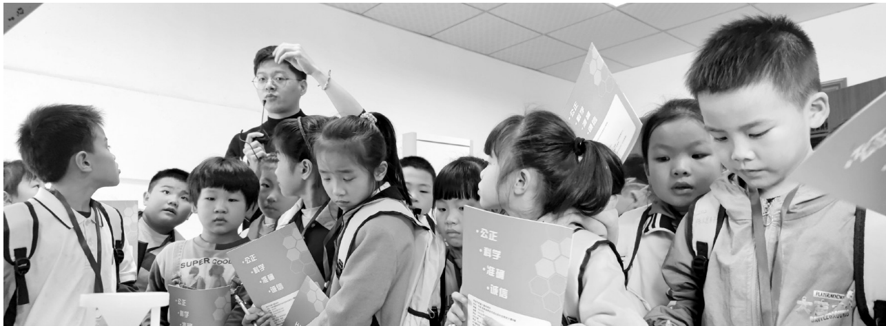
工作人员介绍质检设备。