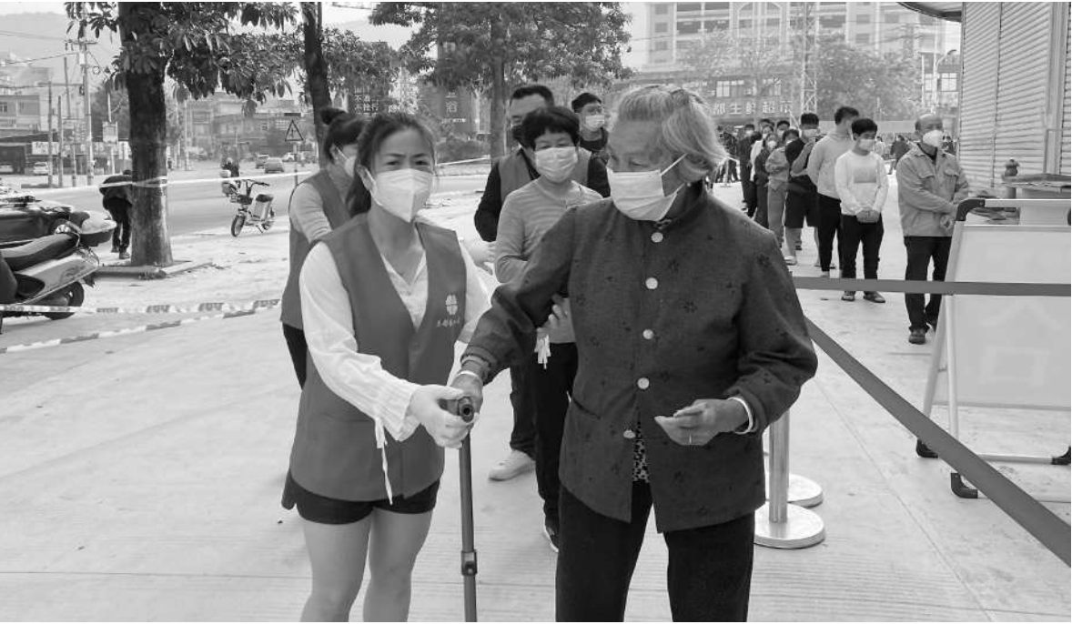
英都福田公益成员主动为行动不便的老人提供服务。