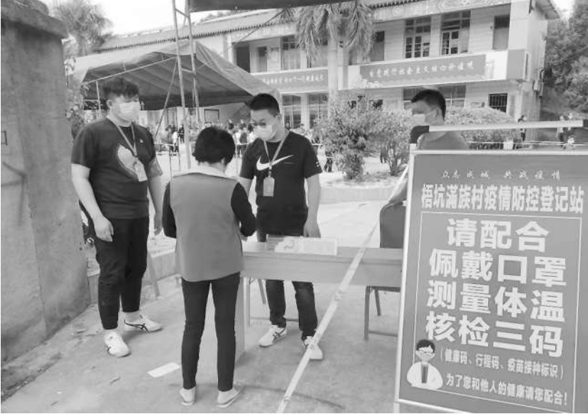
青年突击队员帮忙维持秩序。