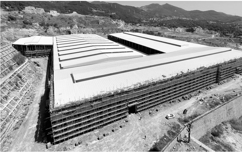
申利卡铝业“智能工厂”施工现场。

限公司创立于2006年，公司位于南安市仑苍水暖高新技术园，占地约60亩，总投资5000万美元，是一家集研发、设计、生产、销售并拥有铸造、旋压、锻造