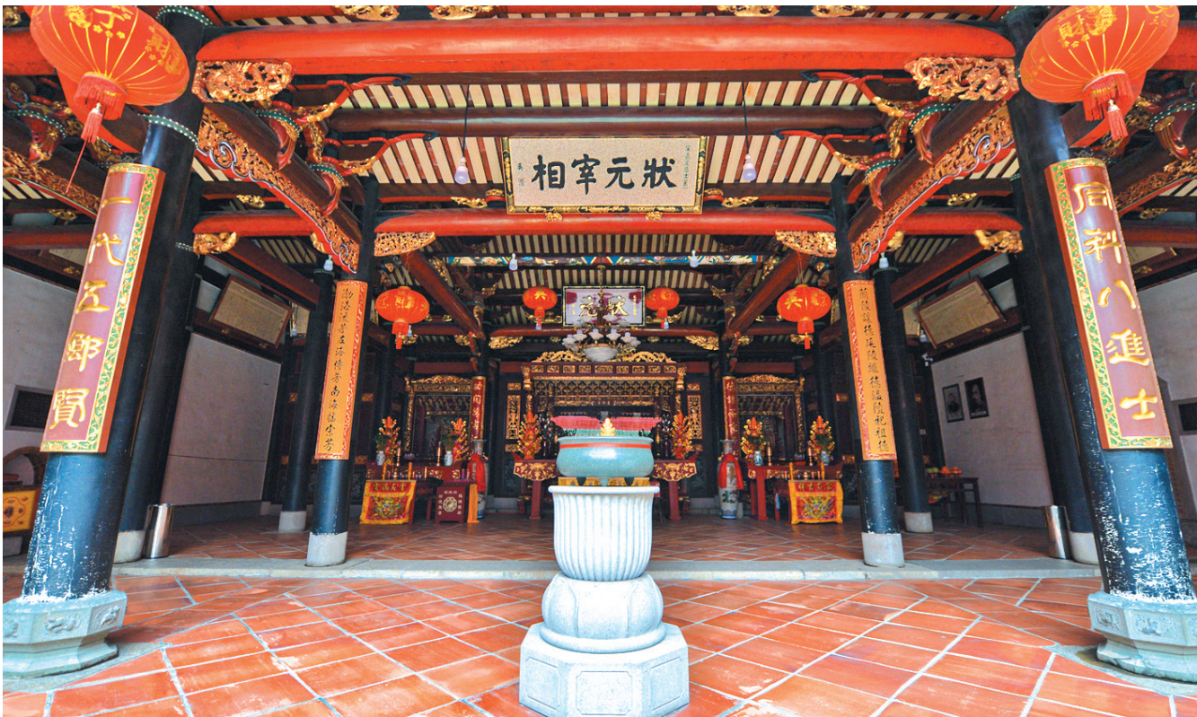
位于泉州市鲤城区的吴氏大宗祠里,悬挂着「状元宰相」的牌匾。

文天祥死后葬于家乡江西省吉安市,而吴潜死后埋骨何方,鲜有人提及。在南安市东田镇西坑村,一个人口不足2000人的小村庄里,有一“也”字形古墓,正是吴潜之墓。出生于浙江德清县新市镇的一代名相,缘何葬于千里之外的南安?回望700多年前那段尘封的历史,可谓惊心动魄。