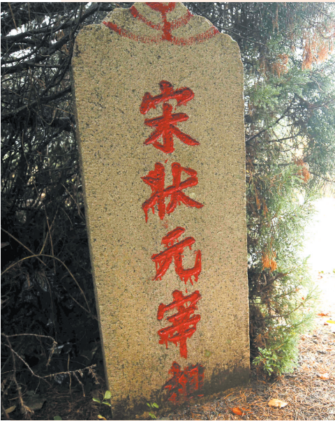
墓的左前方立有“宋状元宰相”石碑。