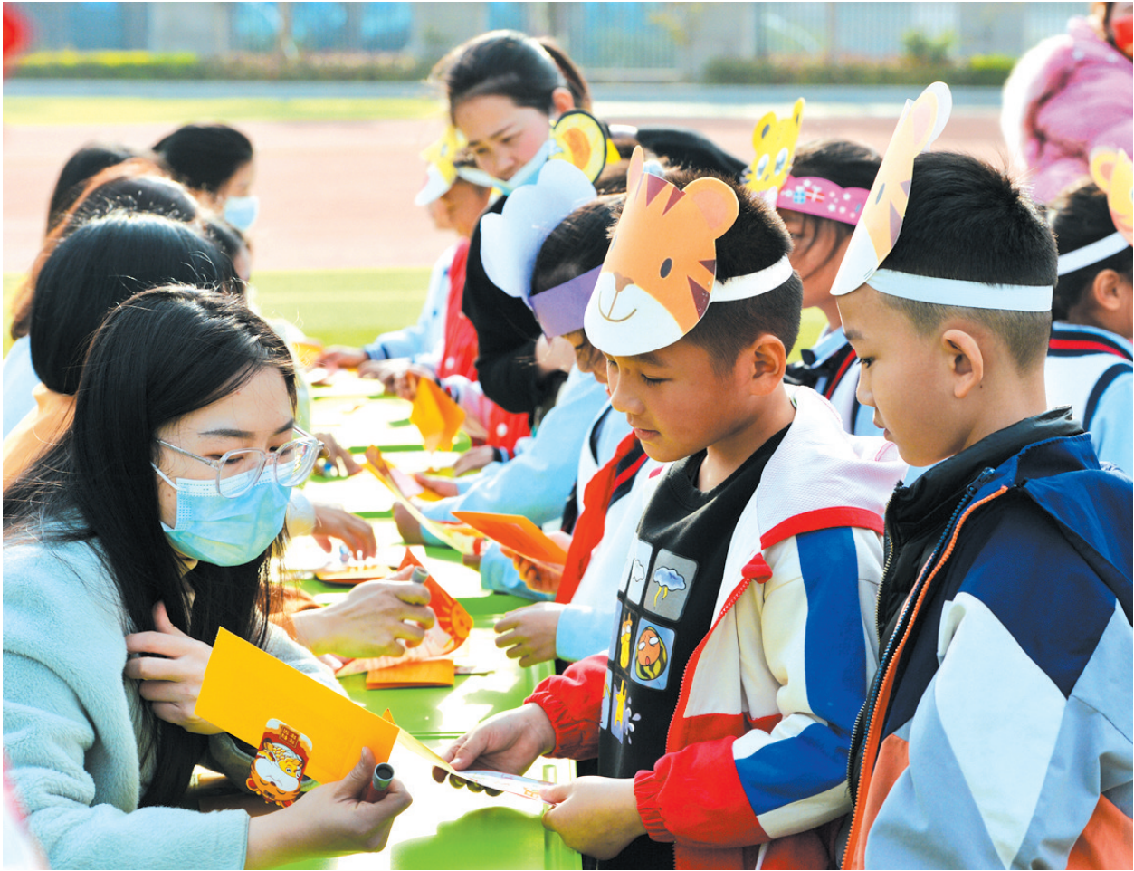
用游园代替期末考，用游戏检验一学期的学习成果。

学校相关负责人表示，通过闯关、积分等趣味活动，不仅展现了学生的学习成果，也丰富了学生的学习生活，让孩子们在轻松欢乐中体会学习的乐趣。