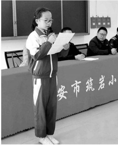
筑岩小学小记者代表发言。

对我们自己来说,我们可以见识到更大的世界,还能把见到的东西记录下来,成为见多识广的人。我一定要好好珍惜这次机会,想到这儿,我手中的小记者证抓得更紧了。