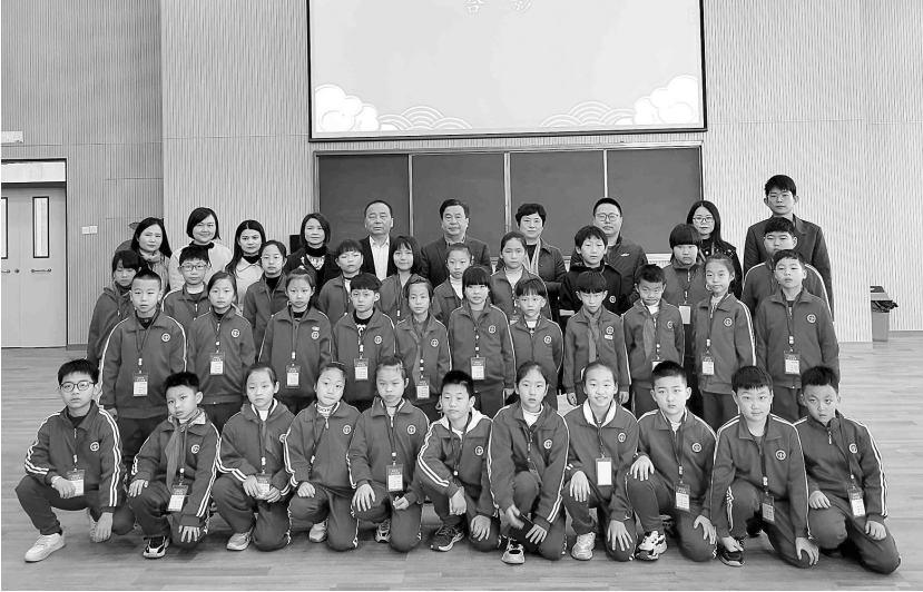
博雅公学小记者合影。