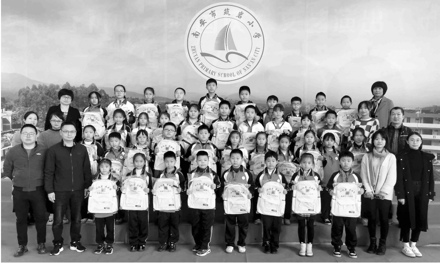
筑岩小学小记者合影。