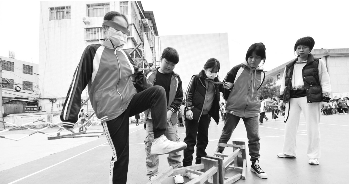
通过协作游戏,让孩子们知道团结协作的力量和作用。

本报讯(记者 黄俊涛 李想 通讯员 黄水洋 文/图)23日下午,由南安市教育局和海丝商报社联合举办的南安市第四届海丝教育节心理健康教育专题活动走进明新小学。