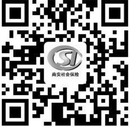
扫描二维码下载名单。

该负责人提醒,名单内的用人单位要于12月28日前将单位账户的开户许可证复印件加盖公章扫描或拍照发到邮箱 sy86377533@126.com,或者拨打社保中心电话告知提供单位账户的具体时间,联系电话:0595—86357533,逾期将视同放弃。