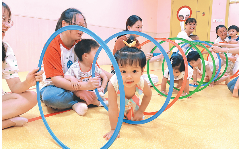
作为南安市儿童早教服务项目基地，格林早教机构连续多年开办“科学育儿·阳光行动”公益亲子课。图为公益亲子课现场。

而这只是南安市加强儿童早期发展服务基地建设、拓展服务内容的缩影。近年来，南安市计生协会引导各乡镇（街道）依托卫生医疗机构防疫窗