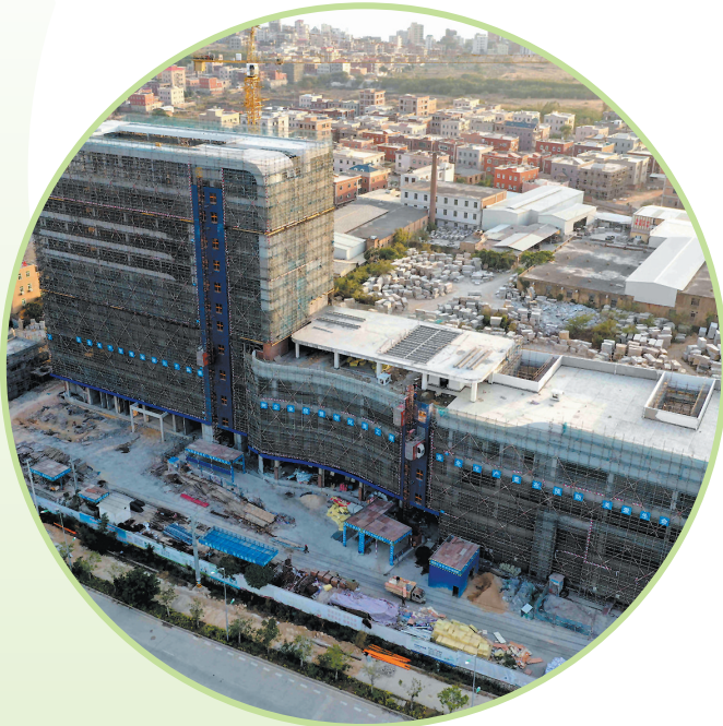
▲成功医院一期项目现场。