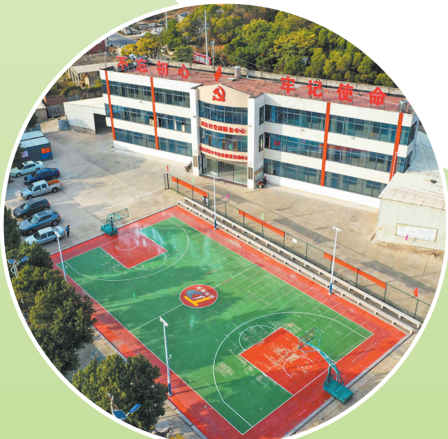
田东村文体活动广场。