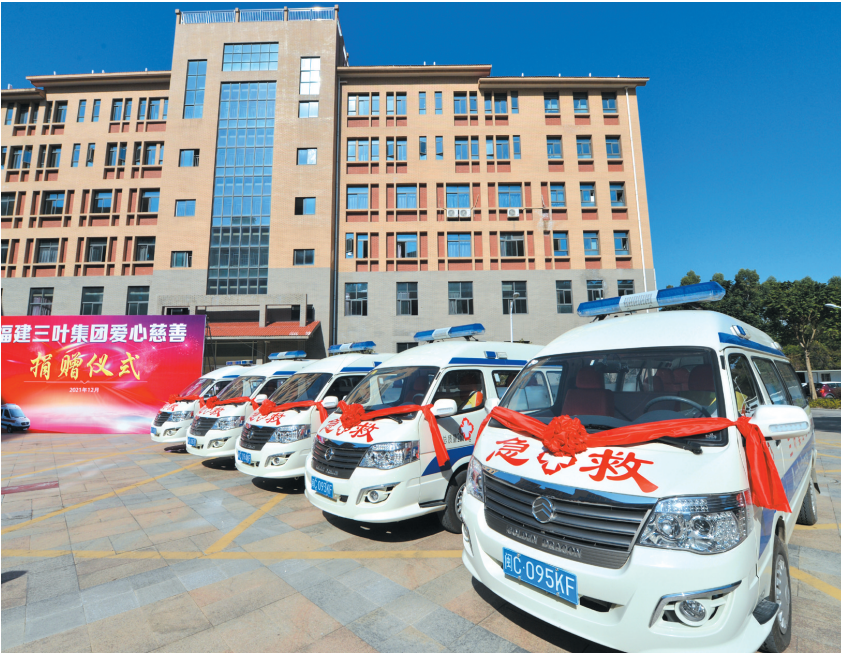
三叶集团捐赠的救护车。

据悉，长期以来，福建三叶集团以“爱国敬业、守法经营、创业创新、回报社会”为己任，时刻不忘企业肩负的社会责任，积极投身公益事业，在企业发展的同时，不断支持南安教育、医疗、村路改造、市政设施等民生事业发展，积极为抗洪救灾、敬老助困、助学助教、疫情防控、乡村振兴等捐款捐物，累计捐资额达 6600 多万元。