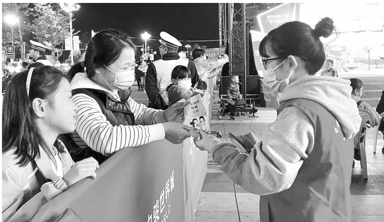
志愿者们向市民分发预防艾滋病的宣传单。

本报讯(记者 黄伟勋 通讯员 叶新新 文/图)11月26日,南安市卫健局、市计划生育协会、市妇幼保健院、市疾控中心在南安中骏世界城开展“世界艾滋病日”宣传活动。