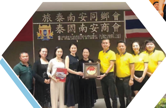
▲2019年,成都南安商会拜访泰国南安商会并送去第九届世界南安青年联谊会邀请函。