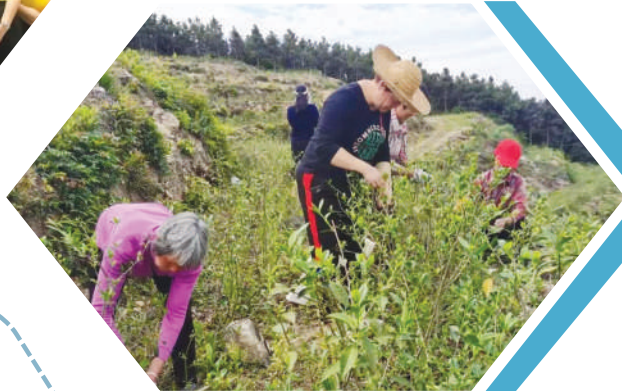
▲深圳市南安企业协会挂钩帮扶向阳马迹村。

南安丰州金鸡古港是举世闻名的古代海上丝绸之路重要起点,宋元时期曾经勾画了“涨海声中万国商”的繁荣景象。秉承独特的海洋文化积淀,南安市积极探索和实践“政府+商(协)会+企业”以加速全球化的发展路子,着力开辟加快推进新一轮高质量发展超越的“新丝路”,促进“南安经济”和“南安人经济”有效融合。