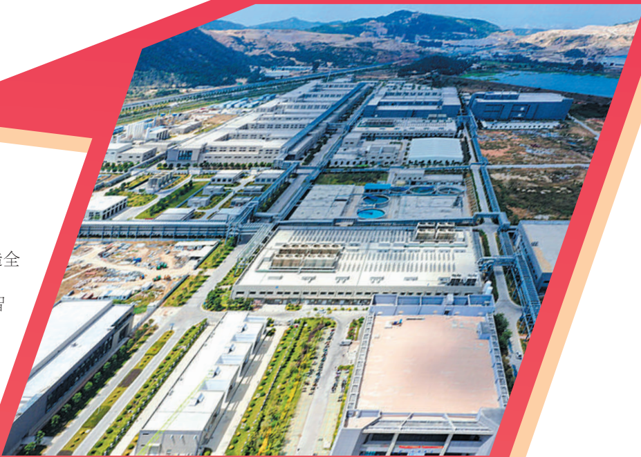
位于南安石井的三安高端半导体项目。

卡奥斯(南安)石材智慧产业园、联东U谷·南安智能制造产业园、泉州(南安)万洋众创城……随着一个个项目的动工建设,南安已然筑起了工业强基,朝着更高目标蓄势腾飞。