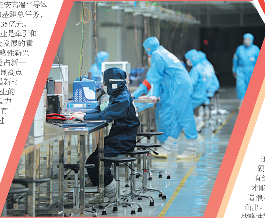
三安半导体生产车间一角。