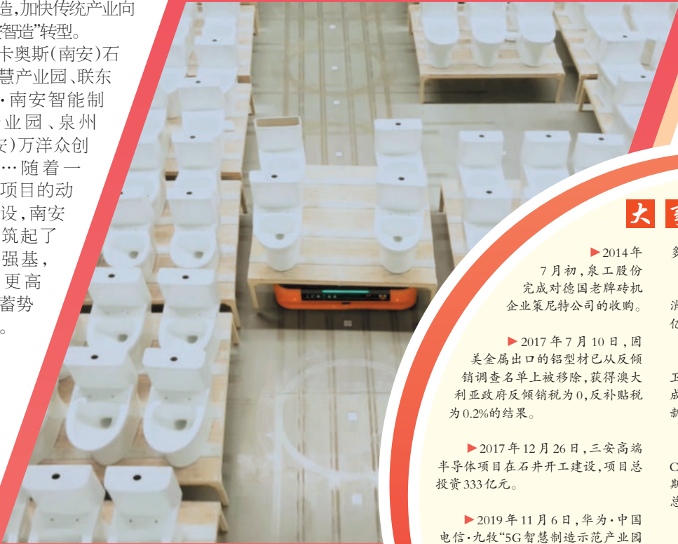
九牧5G智慧工厂,AGV小车装载着马桶,自动识别停泊空位。