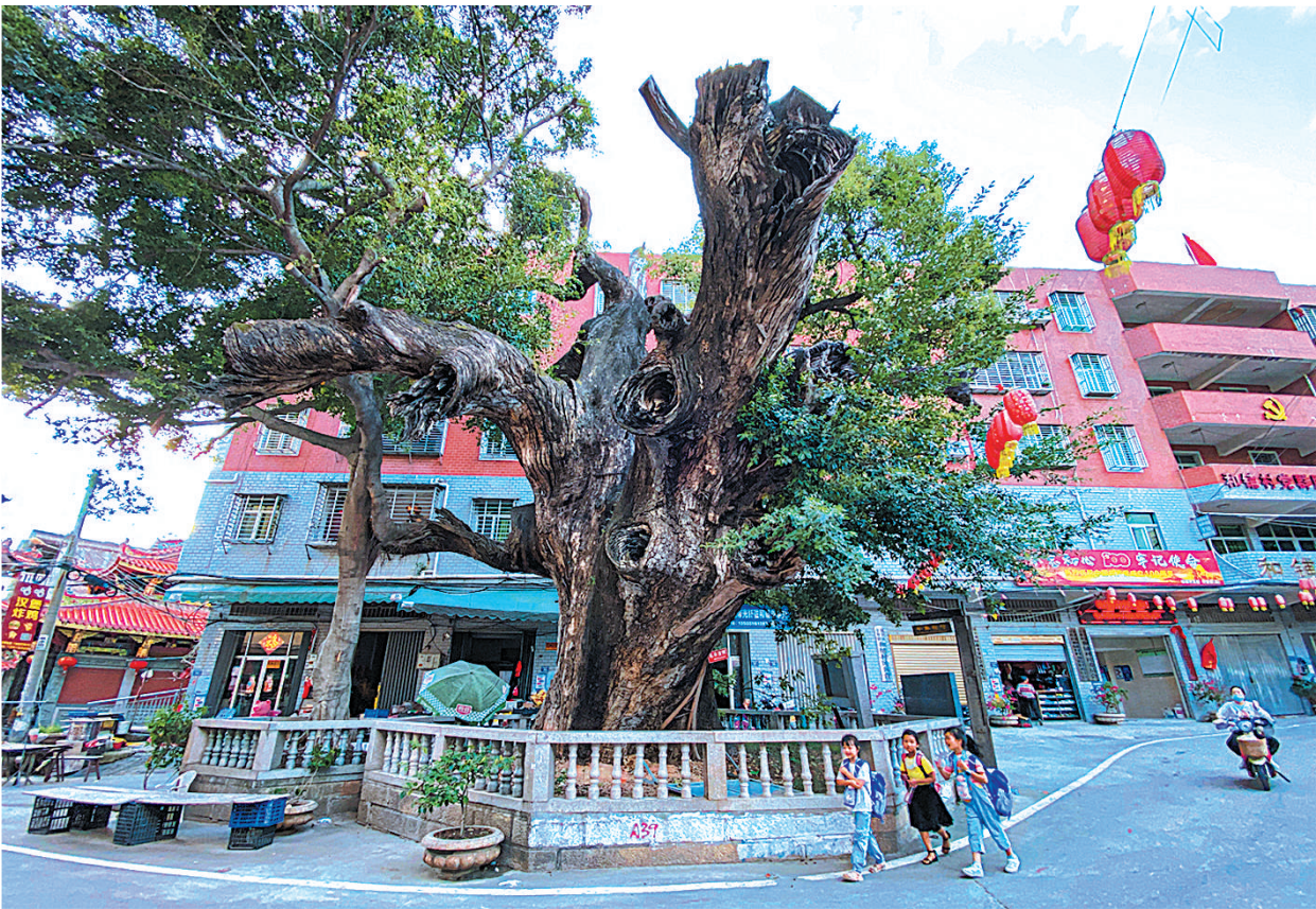
相传王振熙在这棵大樟树下读书。