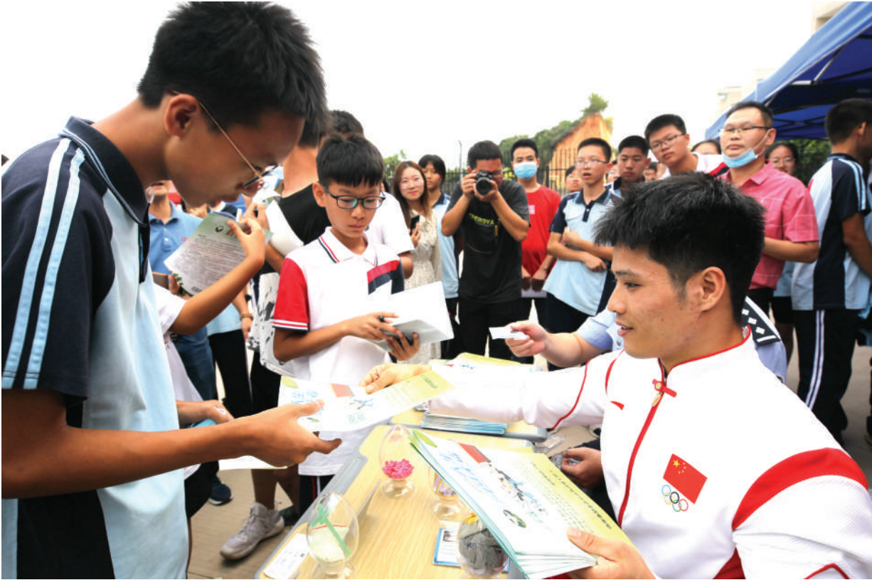
作为南安禁毒宣传形象大使，李发彬在现场为南安一中学子发放禁毒宣传单。