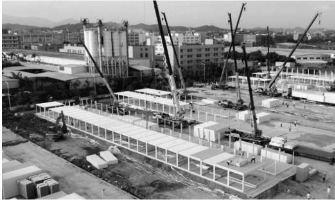
泉港区方舱临时隔离点建设现场。

限公司接到承建泉港区方舱临时隔离点项目的紧急任务。隔离点总建筑面积超4万平方米,设计规模6栋,建成后可用于泉州市疫情防控工作。由于项目时间紧、任务重,方舱建设需在短时间内投入大量的人力、物力及资金购买建设所需原材料、设备和支付人工费用等,一时之间项目建设面临资金短缺的问题。 兴业银行泉州分行在获悉这一