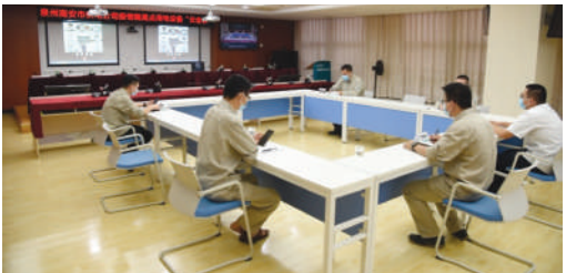
南安供电公司技术人员通过远程指导对疫情隔离点开展线上用电检查。

本报讯（记者 周海文 通讯员 傅泓源 文/图）“师傅，现在请将测温仪对准设备的金属裸露部位进行测温。”近日，国网南安市供电公司“云诊断”中心技术人员远程对疫情隔离点开展线上用电检查。