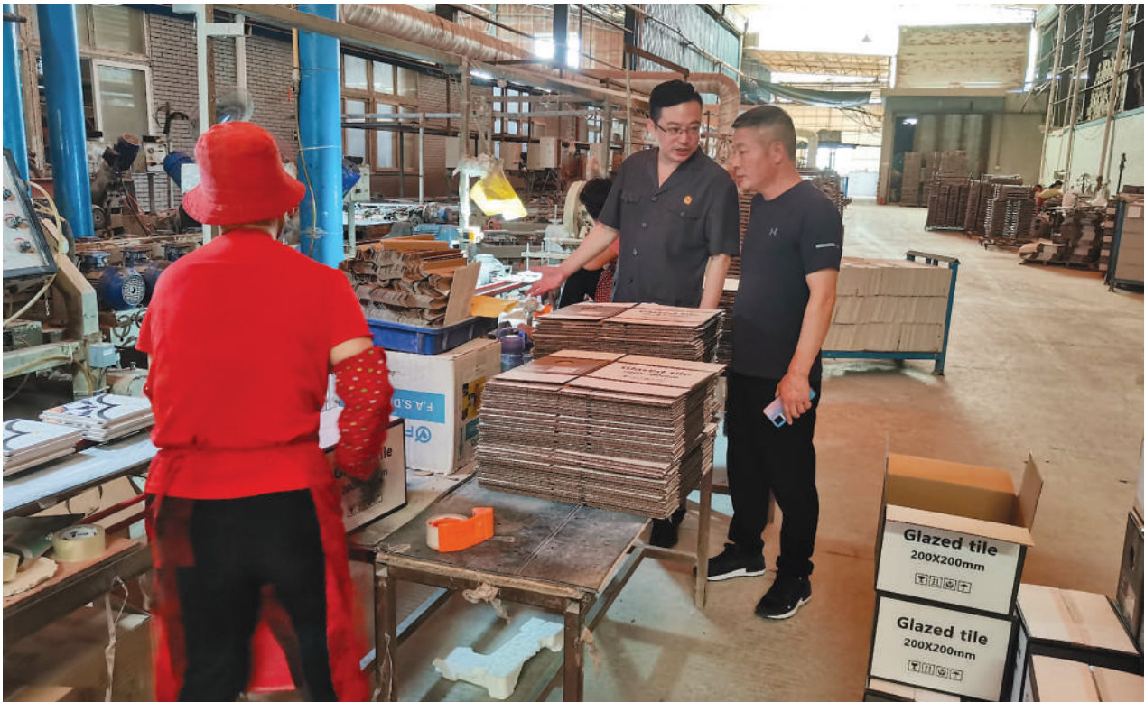
南安法院组织开展“送法进企业”活动。

值得一提的是,该院还充分运用互联网、人工智能等信息技术,建立“线上线下”互补机制,为农民工提供网上立案、在线调解、在线庭审等便民方式,确保疫情期间农民工合法权益及时得到保障。