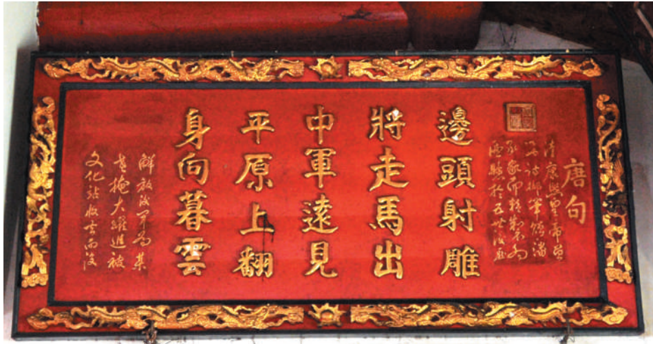
墓庙内的牌匾上写有康熙挥毫赠予潘承家的唐诗绝句。

康熙癸未年(公元1703年),康熙第四次南巡时,潘承家再次崭露头角。据墓志铭记载,康熙南巡至扬州瓜州古渡口,正坐在御船上欣赏风景时,忽遇狂风大作,将船帆吹歪,擅识信风的潘承家负责警卫任务,眼看船有倾覆之忧,连忙跳上御船保护康熙。