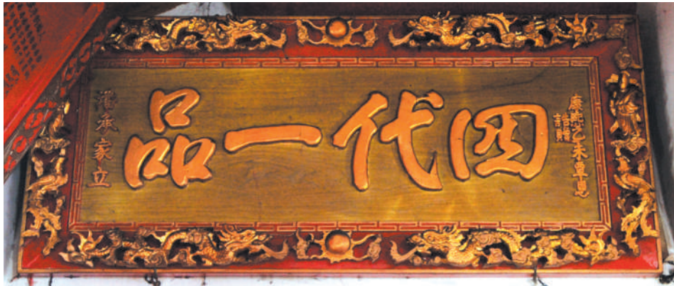
墓庙内的“四代一品”匾额。