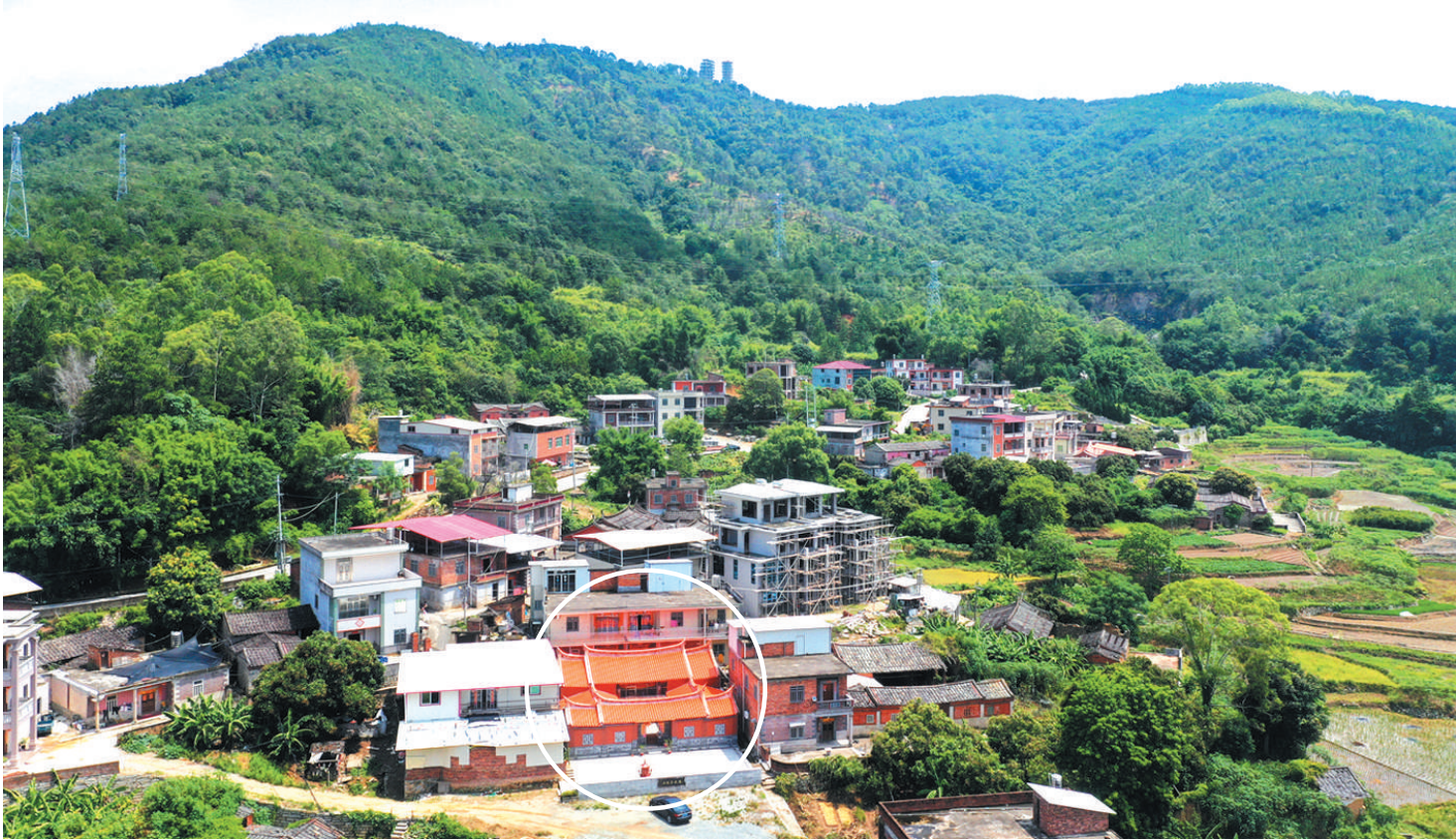
背对慕美山的潘承家故居(画圈处),山的另一面是潘承家墓。

出身贫寒的潘承家勇猛善战,在战乱中得帝王眷顾的事迹,被口口相传至今。300多年来,潘承家一直受到乡邻四舍的敬仰。