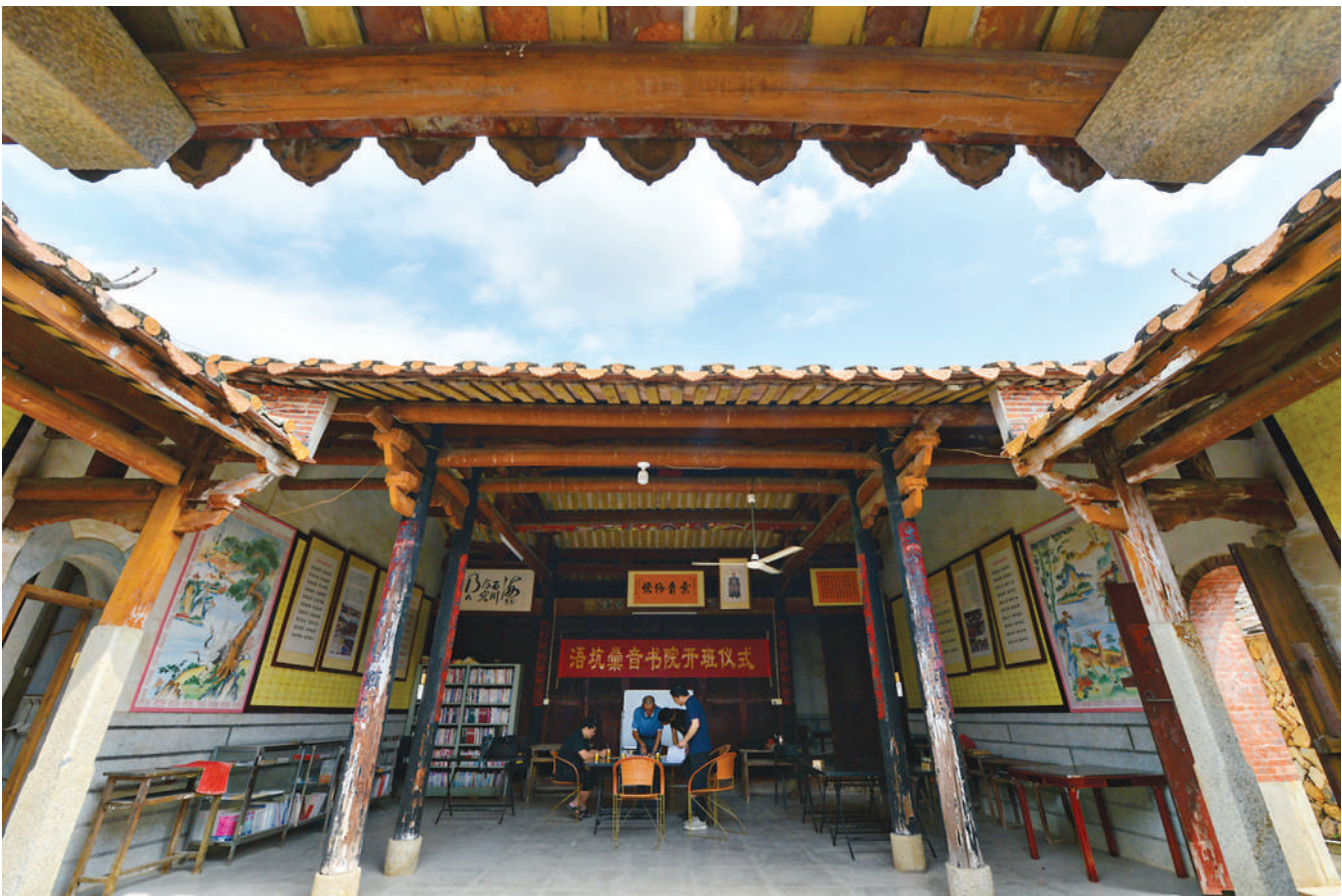
曾经的黄谦故居,如今是浯坑黄氏宗祠和彙音书院。