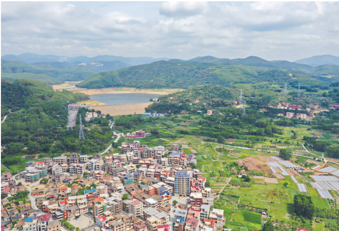
黄谦故居所在的南安市水头镇星辉村浯坑自然村。