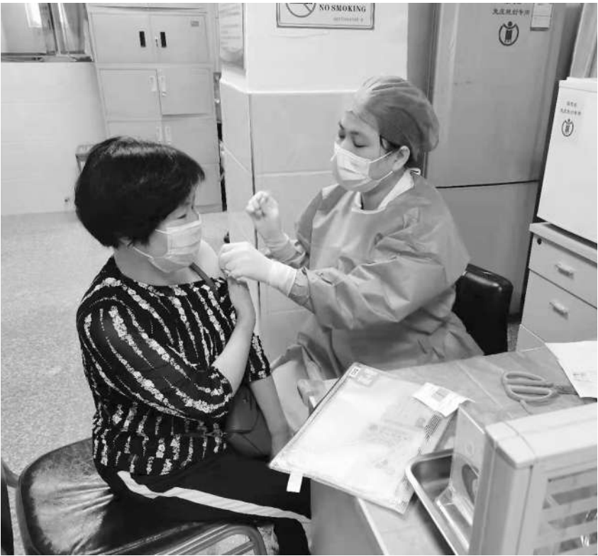
医护人员为市民接种疫苗。

据了解,下一阶段,南安市、永安市、尤溪县三地将同步启动对60岁以上高血压、糖尿病患者、高血压合并糖尿病、健康人群开展接种新冠病毒灭活疫苗后免疫效果评估(检测中和性抗体)及安全性观察随访工作。此次使用的疫苗与目前大规模人群接种的新冠灭活疫苗完全一致,均为获得国家药品监督管理局批准附条件上市的疫苗。