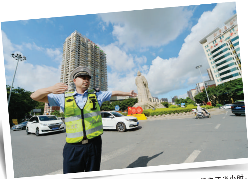
早上8点,在成功雕像环岛执勤的交警已经在阳光下坚守了半小时。

交通民警中还有一支让路面常见警灯闪烁的队伍——交警铁骑队,该队警力67人,分布在南安中心市区及水头、官桥、石井三个重点乡镇。执勤一年多来,他们累计巡逻9.5万公里,每日路面执勤11个小时,累计4015个小时,疏导交通拥堵1000多次,街路面警情主动发现率比升近69%,为救护车、消防车开辟“绿色通道”70多次,完成各类安保50多次,救助群众100多起。