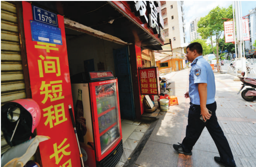
高温不服“暑”,社区民警坚守在社区走访、服务居民的第一线。

围绕人民群众关心的治安防控、打击犯罪、服务民生等方面工作,近年来,柳城派出所社区民警开展行动30余次,讲座培训28次。点点滴滴,只是柳城派出所立足本职、打击犯罪、维护治安等的一个个缩影,忠诚履职尽责,主动担当作为,平安润净土,万家享安宁,他们一直在路上。