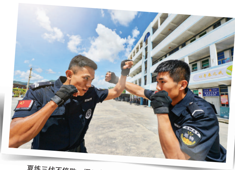
夏练三伏不停歇。摄于南安市公安局巡特警反恐大队训练场。

据悉,南安巡特警反恐大队警力98人,近年来,出动巡逻警力10800人次,巡逻车辆6300辆;日巡逻警力60人次,5分钟快速反应率达100%,宣传覆盖面超1.5万人次;完成各类安保18场次,救助群众80余起;共组织演练14次,督导检查23次。