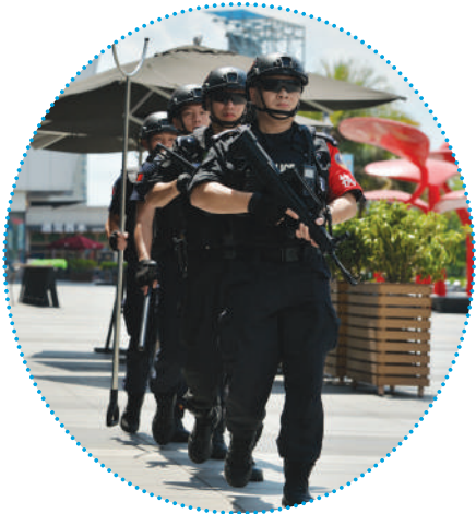
在阳光下保障人民安全。