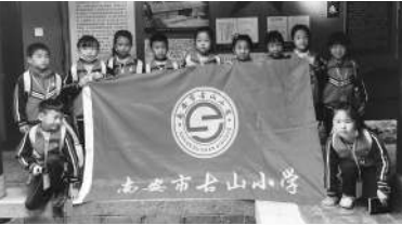
古山小学小记者学习红色文化。