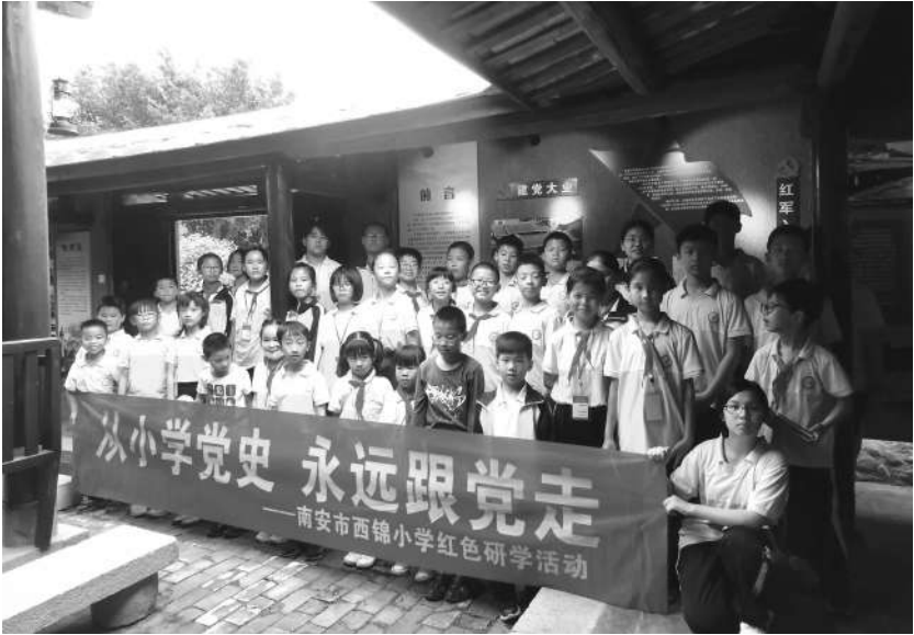
西锦小学小记者红军书院合影。

通过这次拔河比赛，我明白了团结就是力量。只要我们的心凝聚在一起，什么困难都难不倒我们。也让我真正懂得了，别人都在努力，都在进步，所以我们也应该更努力。