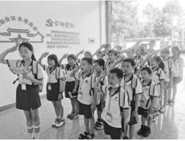
第二小学小记者行少先队队礼。