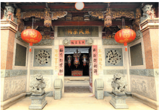
位于南安市康美镇梅元村的阜阳苏氏宗祠。