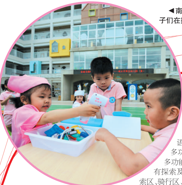
►南安市第五幼儿园,孩子们在操场上玩耍。

放眼南安,各个产业园的标准化建设如火如荼,形成了多点开花,各具特色的园区协同发展新格局。