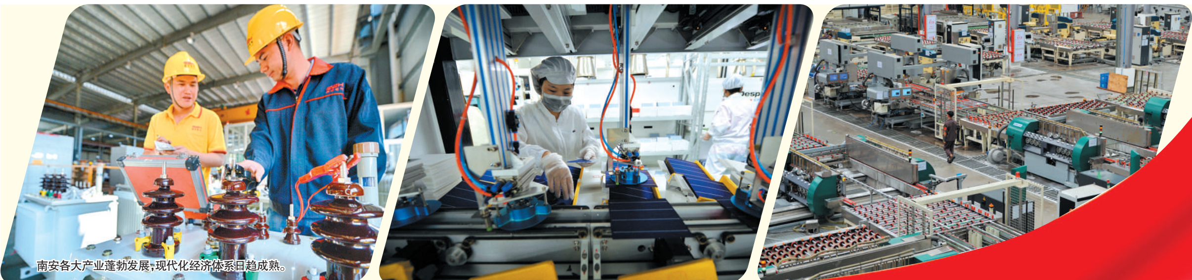
南安各大产业蓬勃发展,现代化经济体系日趋成熟。