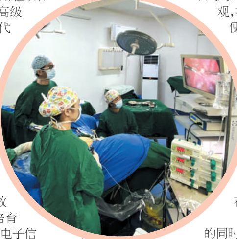
▲上海医疗专家带领南安市中医院团队进行腹腔镜手术。

踏上“十四五”发展新征程,南安将谋划加快构建现代化经济体系的新路径,聚焦产业基础高级化、产业链现代化,加快5G、物联网、工业互联网、人工智能等“新基建”布局建设,推动优势制造业智能化、网络化、数字化转型,培育壮大半导体、电子信息、智能制造、高端装备、数字经济等新兴产业、新业态。