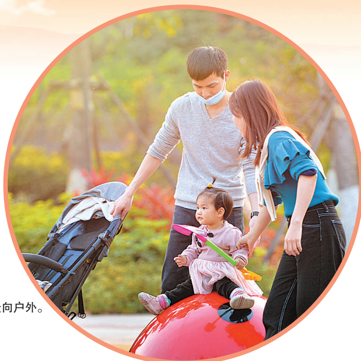
►南安市空气质量持续良好,暖阳下,市民纷纷走向户外。