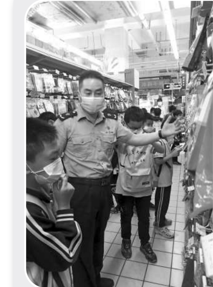
学会辨别三无产品。