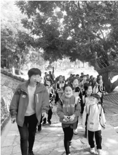
小记者进西峰参观学习。