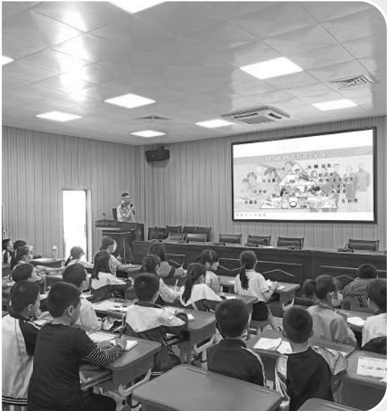
工作人员讲解食品安全知识。

脏、肝脏负担,建议在白天吃,配以水果蔬菜,以利于排毒。还有就是油炸食品:第一,油炸食品在高温制作中,因为油温过高,会导致失去大量营养物质,对人体并没有多少好处。第二,油炸食品吸收了很多油在里面,含有大量的不饱和脂肪酸,长期吃油炸食品,可能会导致高油脂高胆固醇,对血管弹性没有好处。第三,油炸食品是属于比较不好消化的东西,长期吃,可能会加重胃肠道的负担。第四,油炸食品本身不含有纤维素、维生素以及矿物质含量过少,不能够提供人体本身所需要的能量。