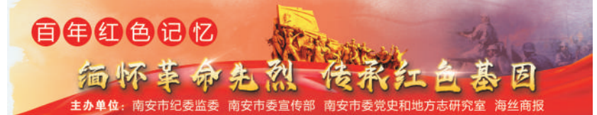
百年红色记忆 缅怀革命先烈 传承红色基因 主办单位:南安市纪委监委 南安市委宣传部 南安市党史和地方志研究室 海丝商报

商的“抢米斗争”,年轻的叶忠参加研究和部署了这一斗争,并负责外围监视工作。“抢米斗争”打击了国民党顽固派的嚣张气焰,但也引起了他们的疯狂反扑,泉州中心县委为此决定转移。 同年9月,叶忠奉命与郑堂楚到官桥、白垵一带筹集革命经费时被捕,并被监禁在国民党晋江县监狱,之后他饱受严刑拷打,仍坚贞不屈,严守党的机密。他化名林志,谎称自己是安溪人,和同伴吴明(郑堂楚的化名)为生活所迫而走险去“劫款”。“我尚未结婚,没有妻女,你要争取活着出去,继续为党工作。”叶忠一人为了掩护郑堂楚,坚称自己是主犯,吴明只是胁从,一人揽下所有责任,因此被国民党军法处判处死刑。其间,党组织设法组织营救,但叶忠认为条件不成熟,请组织不要冒险。 1940年12月12日,年仅20岁的叶忠,在泉州南校场英勇就义。