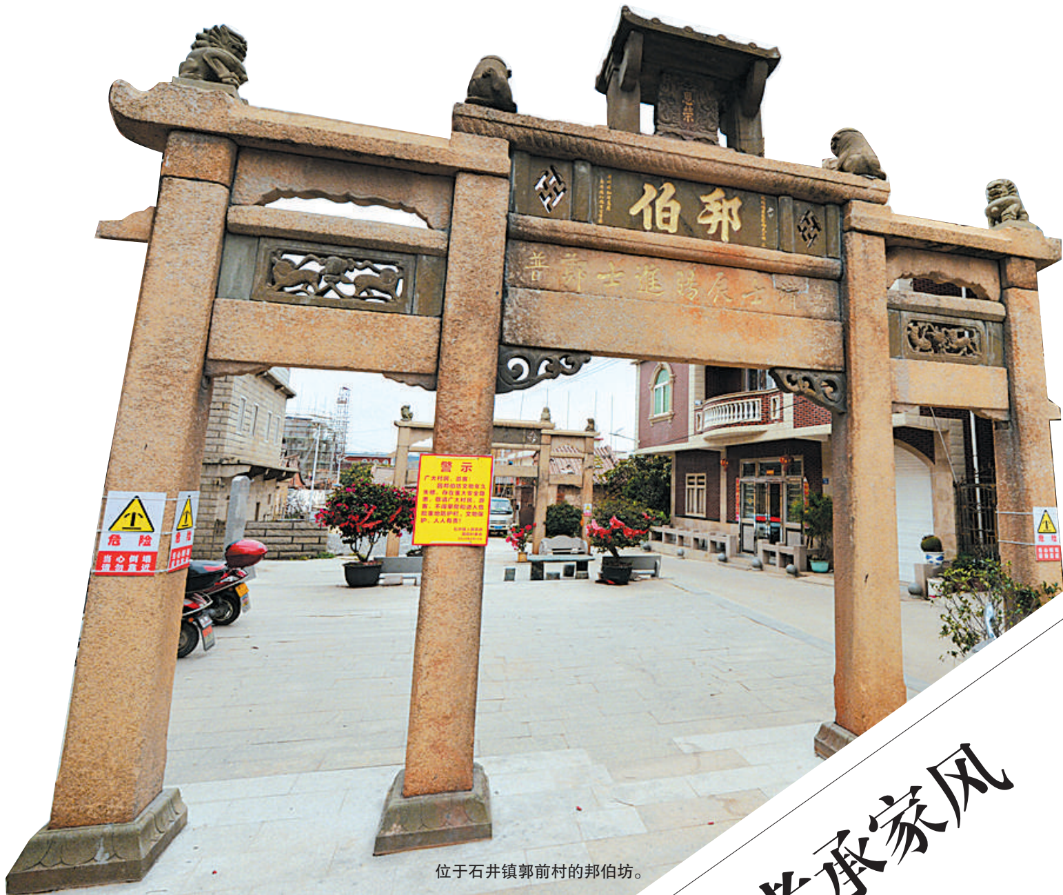
位于石井镇郭前村的邦伯坊。

这位南安人,是明朝嘉靖年间才华横溢的联捷进士,当过无锡知县、南京户部主事,为官清廉,政绩斐然,深受百姓拥戴,上司荐举。而在即上任云南府知府,主持军政大事时,突遭家庭变故,父母相继离世。自此,回家守孝数年,致力于桑梓教化。 守孝期满,进京面圣等待授官时,命运又跟他开了一个玩笑。当时还踌躇满志的他,骤感热疾,呕血数斗与世长辞,享年不过56岁,令人惋惜。 400多年风雨沧桑,为他而建的邦伯坊仍岿然于世,诉说着昔日荣光。 他是谁?为何在历史长卷中留有浓墨重彩的一笔?让我们走进南安市石井镇郭前村,揭开神秘面纱。