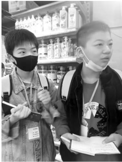
小记者认真聆听讲解。