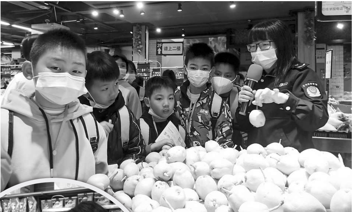
▲监管人员带领小记者鉴别水果优劣。 ◀学习辨别商品，保护自身利益。

特地走到了好生活广场，排着整齐有序的队伍走进好生活超市，我们的参观活动就此开始了。