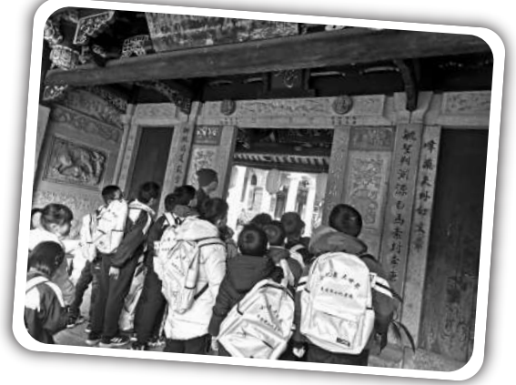
▲小记者了解古寺建筑特色。

动摇，而且也能断除种种杂念，以达到‘一心不乱’的境界。”师傅还意味深长地补充一句，“如果同学们也有‘一心不乱’的定力，就能把书读好。”我们恍然大悟，不由得点点头。