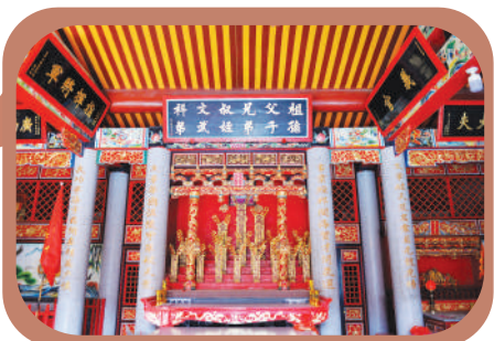
▲昭毅将军祠中悬挂有嘉靖皇帝赐予欧阳深的匾额。