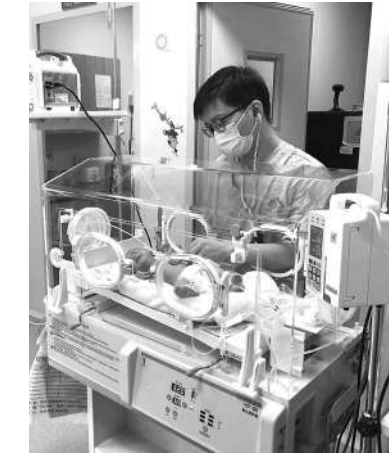
新生儿重症监护病房的医生为患儿检查。

此外,新生儿高胆红素血症发病率也很高,也就是俗称的“黄疸”,“闽南地区对这个病症的认识不足,