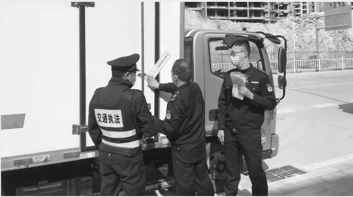
执法人员正对被查获的冷藏车进行现场封存。

市民选购冷链食品时应注意以下几点： 1.到正规的超市或市场选购生鲜产品，选购时可使用一次性塑料袋反套住手挑选冷冻冰鲜食品，避免用手直接接触，同时，正确佩戴口罩。 2.购买预包装冷冻冰鲜食品时，要关注生产日期、保质期、储存条件等食品标签内容，保证食品在保质期内。 3.购物后及时用肥皂或洗手液清洗双手，洗手前，双手不碰触口、鼻、眼等部位。 4.购买进口冷链食品时应查验进口报关单、检验检疫证明、核酸检测阴性报告和消毒证明，做好外包装消毒。