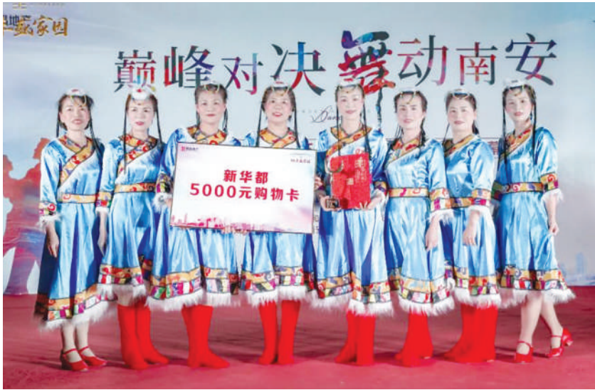
四季家园姐妹队领取购物卡和证书。

记者,初赛过后,她们一个礼拜内准备了2支舞蹈,因为队友各有工作,平时只能晚上抽空练习。当晚她们带来的是草裙舞,有的队员仅学了4天。“希望能给