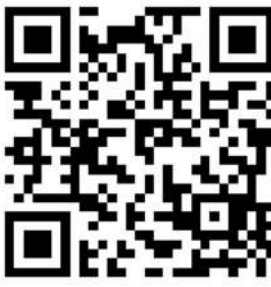
扫描二维码查看晋级名单。

福利不止这些！本次比赛冠军队伍每个人还可以获得3张源昌·丰盛家园9.9折的购房优惠券，亚军队伍每个人可以获得2张源昌·丰盛家园9.9折购房优惠券，季军队伍每个人可以获得1张源昌·丰盛家园9.9折购房优惠券，所有优惠券不与现场优惠重叠，除了个人外，身边的亲朋好友也可以使用；针对参赛队伍购房或者介绍朋友购房即可获得1%的房源总价佣金再加6000元现金奖励，再加随机抽取精美品牌家电一份。