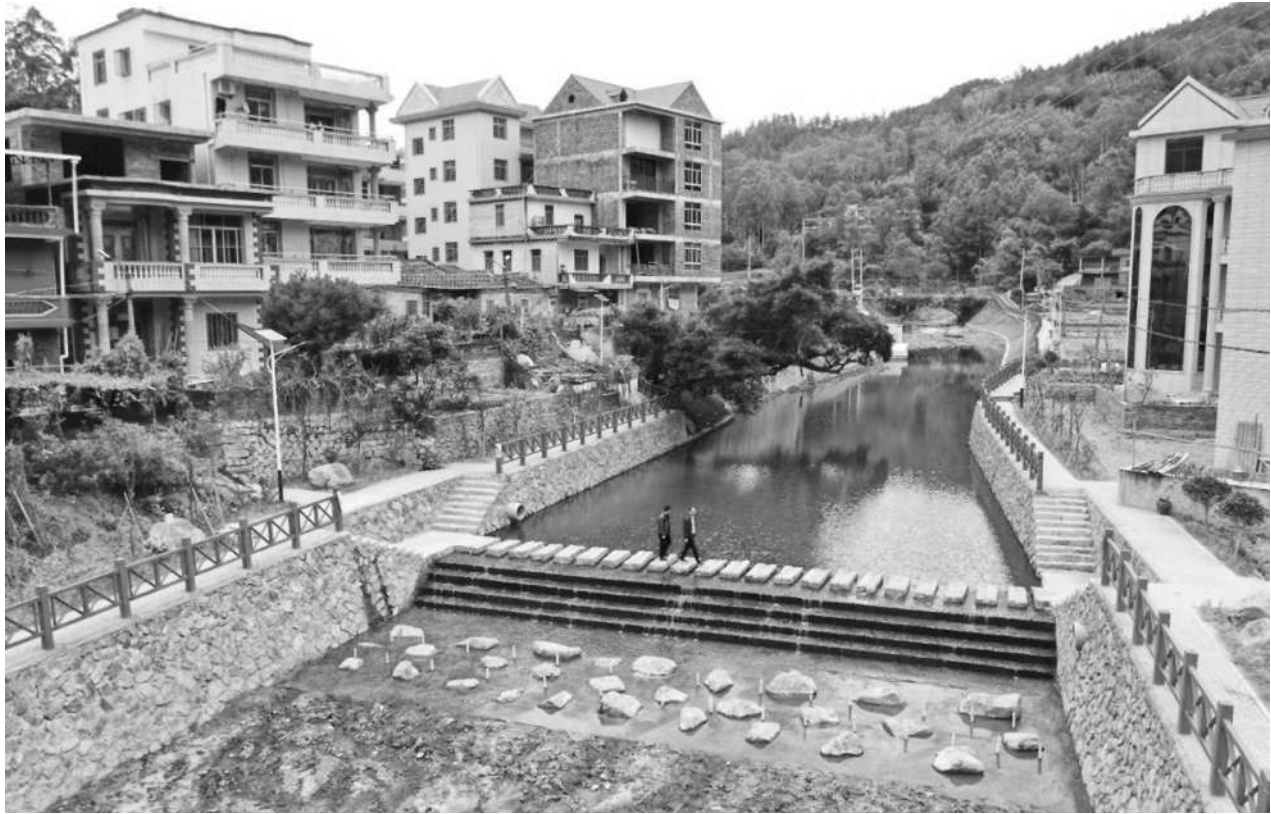
整治后的罗溪乐峰段环境更加优美。

生态保护蓝线19.62千米。整个河道清淤长度1780米，清淤量达9700立方米。项目于2020年02月22日开工，11月13日完工。