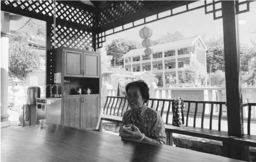
在龙兴寺公园的休息亭内,一位老奶奶在悠闲地喝茶。

日前,记者来到梅山镇埔仔村龙兴寺,沿着水泥路一直往前,一座休息亭出现在眼前。一位老奶奶坐在亭内,悠闲地品着茶水。 走进亭内,记者发现亭内一角设有爱心奉茶站,上面写着“药师院供”。奉茶站旁边有一台饮水机和一個茶柜,茶柜里放有热水壶、茶具等泡茶工具。 这位老奶奶告诉记者,她家离这