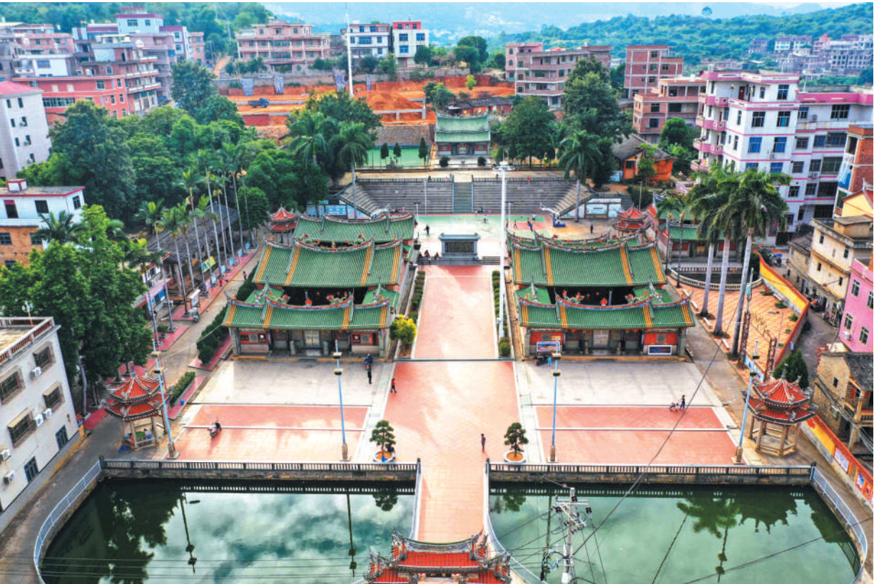
从空中俯瞰,洪氏家庙与洪氏大宗祠形成品字形,祠宇建筑群蔚为壮观。

由洪启睿倡建的洪氏家庙,位于英都镇荣星村凤山东麓,始建于明万历丁巳年(1617年)。内建有东轩、西轩两座家庙,因年久失修,于1993年重建。重建过程中,1996年在东西轩屋后上方,择址复建废墟于清末的洪氏大宗祠,并于当年农历九月竣工。建成后一共占地1万多平方米,成为福建省规模最大的祠宇建筑群。