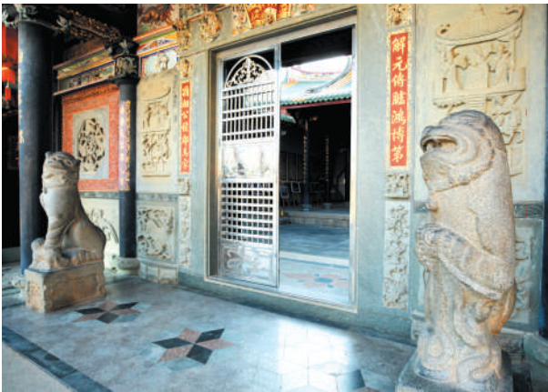
洪氏家庙东轩门口一对明代石狮子憨态可掬。