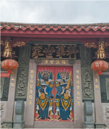
大门石刻为陈庆镛题联。