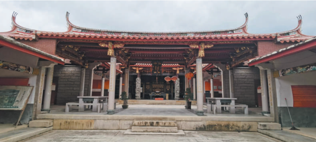
宗祠内典型的十三落结构。