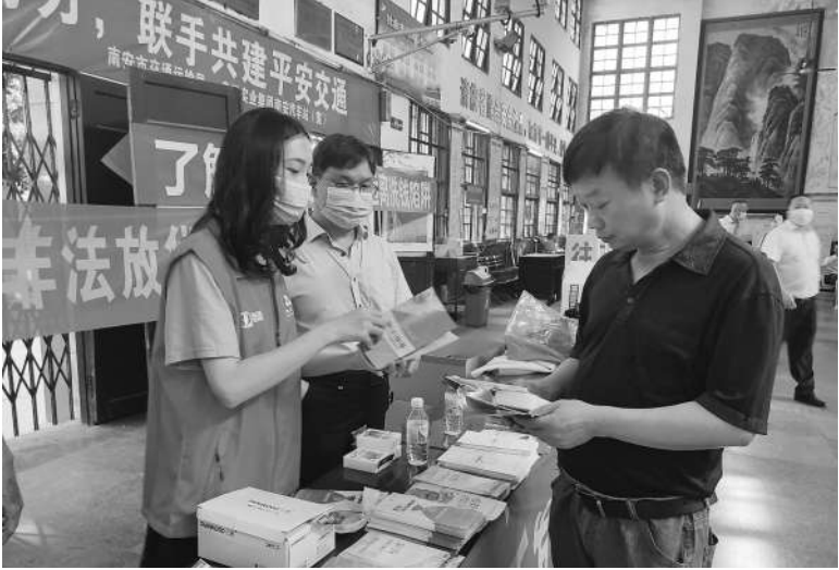
工作人员向市民介绍反假货币知识。

在南安汽车站候车厅,16日上午9时,工作人员在活动现场布置宣传台,摆放反假货币宣传折页、2019年版第五套人民币宣传手册、人民币图样使用等宣传手册。一旦有市民进站,工作人员拿起宣传页向市民介绍识别真假人民币的简易步骤,“新版5元人民币要来了,学习它的防伪小知识‘一转二摸三透光’有备无患,一转是新钞正面的‘光彩光变面额数字’,在转动观察的时候,颜色会发生变……”学习了新版5元人民币知识后,工作人员还邀请人们参与2020年反假币小超人之小超带你识新钞活动专题及2020年南安市反洗钱有奖知识竞答,通过线上线下结合的方式将反假货币和反洗钱知识送到广大群众