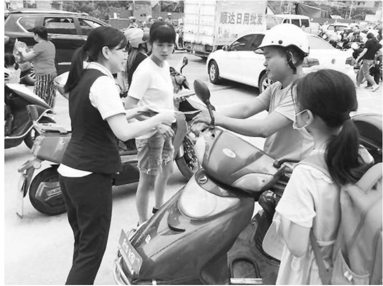
工作人员向市民发放宣传资料。

本报讯（记者 王小清 文/图）“这是即将发行的2020年版第五套人民币5元纸币宣传手册，您可以了解一下。”“这是假币处理办法的介绍，日常生活中如果收到假币，应当主动上交自觉支持和配合金融机构收缴假币”……近日，泉州银行南安支行在省新中心小学门口分发宣传折页，向过往的家长学生普及反假货币相关知识。 9月是反假货币宣传月，进校园是泉州银行南安支行开展宣传的形式之一，该行还在网点营业厅设立公共教育区，摆放反假货币相关宣传资料，供客户阅读。同时，大堂经理向来网点办理业务的客户宣传反假货币宣传知识。 此次宣传活动不单着眼于反假货币宣传，还与“人民币知识进社区”活动、2020年版第五套人民币5元纸币（以下简称新版5元人民币）发行宣传等工作相结合，加大线上宣传力度，大力开展城市社区、农村和边远地区的反假货币宣传，扩大反假货币宣传工作覆盖面，让公众获得更多的反假货币知识，提升公